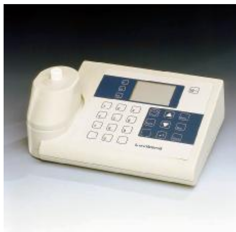
Fotometr MultiDirect s adaptérem

Díky přiloženým 7 standardním akumulátorům je přístroj schopen okamžité práce v terénu. Můžete je také v nouzi kdykoli vyměnit za běžné alkalické baterie.