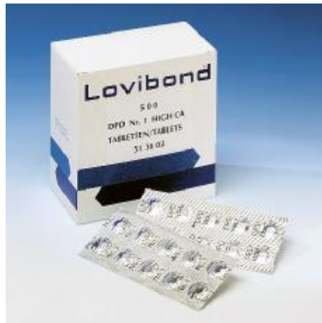
Reagenční tablety v hliníkové fólii