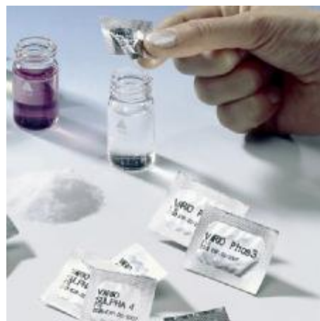
Práškové reagentie Powder Packs

Alkalita (celk.) Alkalita-m Alkalita-p Amoniak Brom DEHA Dusičnany Dusík celk. Dusitany Fluoridy Fosforečnany Hliník Chlor Chlordioxid Chloridy ChSK Křemičitany Kyselina kyanurová Mangan Měď Močovina Molybdenany Ozón (i vedle Cl 2 ) Peroxid vodíku pH Sířany Sířičitany Sulfidy Tvrdost (Ca) Tvrdost celková Zinek Železo